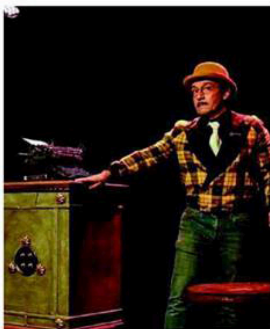
La famille Crocheffort déjoue les serrures les plus ingénieuses. Les Chats Mots Passant de girafe et les Pères Noël se retrouveront à la gare de Guîtres.

Saint-Loubès Jusqu'au vendredi 4 janvier, 14 h à 18 h et de 15 h à 18 h 30, les 24 et 31 décembre jusqu'à 17 h. Fermée les mardis 25 décembre et 1 er janvier. Entrée libre avec prêt de patins. Port de gants obligatoire. Dans la cour de l'école Hector-Ducamp. Saint-Sulpice-et-Cameyrac Jusqu'au lundi 31 décembre. Tous les jours de 15 h à 19 h, sauf le mardi 25 décembre. Gratuit. Saï des sports.