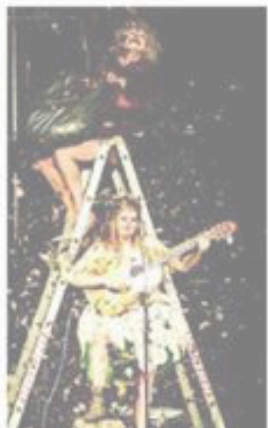
Le cirque Pardi met en scène de drôles de personnages.

Des objets bizarres, des personnages curieux, des clowns étranges, des acrobates bordelines... La galerie de portraits du cirque Pardi est unique. Son spectacle « BorderLand » est donné encore trois jours, puis les chapiteaux jaunes quitteront le parc des Angéliques pour d'autres aventures. Demain et samedi à 20 h 30, 10, 12 et 15 €. Durée : 1 h 15. Gratuit moins de 5 ans. 07 82 85 15 05.